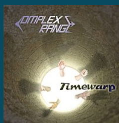
Complex Range Timewarp